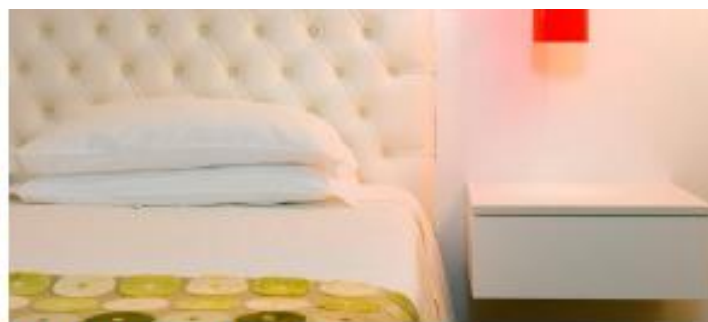
HOTEL FLORIDA ★★★★★