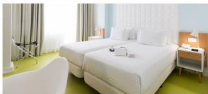
LEGENDARY PORTO HOTEL ★★★