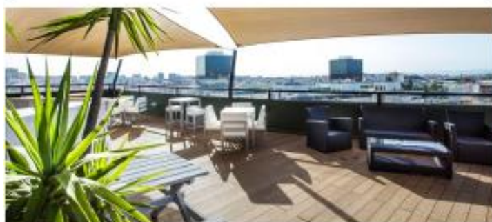
HOLIDAY INN LISBOA ★★★★★