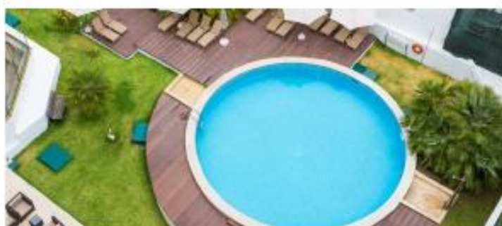
LEGENDARY LISBOA SUITES ★★★★★