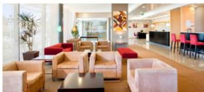
HOLIDAY INN EXPRESS LISBON-OEIRAS ★★★