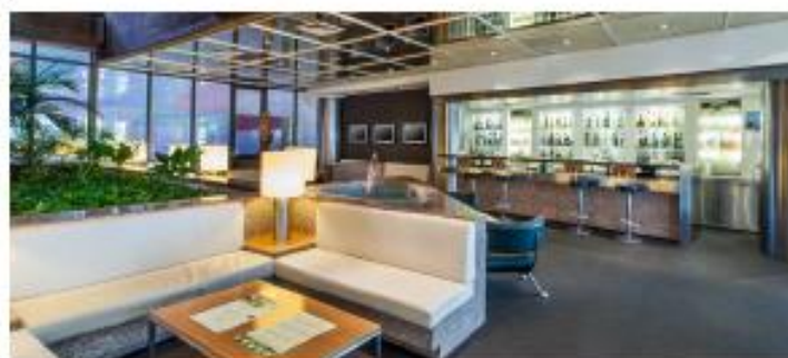
HOLIDAY INN LISBON-CONTINENTAL ★★★★★