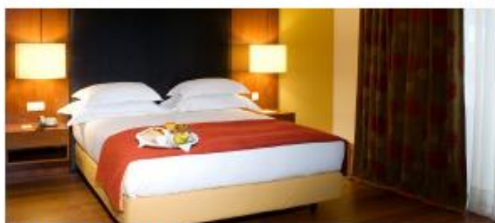
LEZÍRIA PARQUE HOTEL ★★★★★