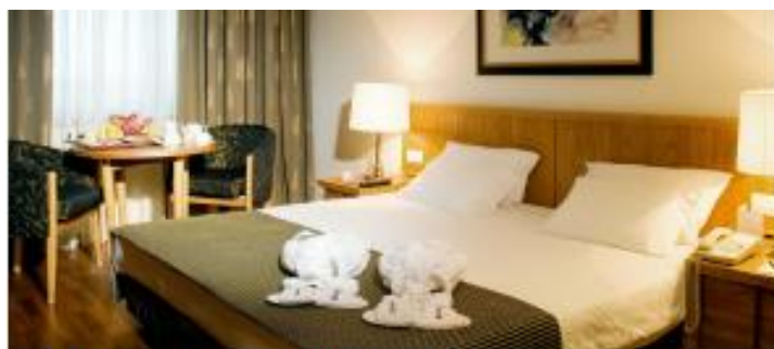
RADISSON BLU LISBOA ★★★★★